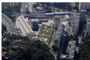
Centro multimodal – Tranvía de Niza