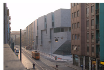
Universidad Luigi Bocconi