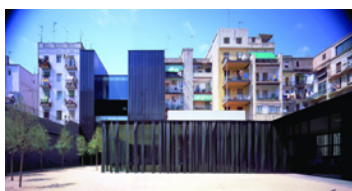
Biblioteca, hogar de jubilados y espacio interior de manzana

Este proyecto ha sido financiado con el apoyo de la Comisión Europea