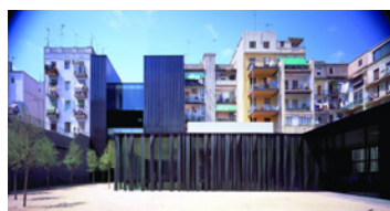
Biblioteca, casal d'avis i espai interior d'illa

Aquest projecte ha estat finançat amb el suport de la Comissió Europea