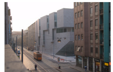
Universitat Luigi Bocconi