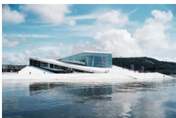
Òpera i Ballet de Noruega